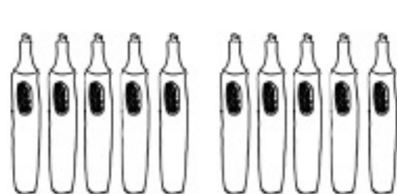
10 Neuland N°One®: 4 noirs, 2 rouges, 2 bleus, 2 verts